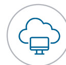
Verwaltung von Katalog & Renewals

Unterstützt durch ein umfassendes Service-Governance-Modell wird dies durch optimierte Beschaffungsprozesse, Transparenz aller Softwaretransaktionen, verbesserte Endusererfahrung und ein proaktiveres Renewalmanagement erreicht.