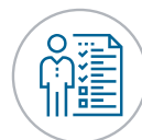
Programmatische Übersicht & Governance